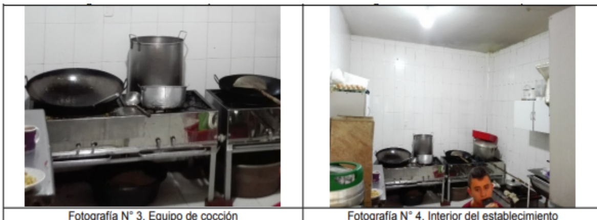
Fotografía N° 3. Equipo de cocción